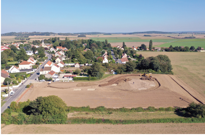
Été 2021, apport et mise en œuvre des terres inertes

Le projet a été réalisé et financé par ECT grâce à la réutilisation des terres inertes issues des chantiers locaux du BTP. L'expertise d'ECT a assuré l'analyse, la caractérisation, la traçabilité et le contrôle des terres inertes reçues.