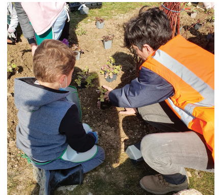
Mars 2022, les enfants de l'école d'Iverny participent à la végétalisation du parc.

Au 1 er trimestre 2022, les enfants de l'école d'Iverny ont pu découvrir le nouveau parc et participer à la plantation d'arbres pour contribuer directement à la renaturation du site.