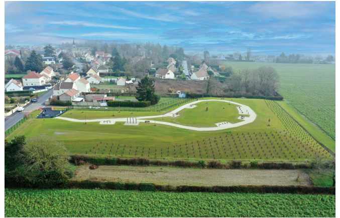
2022, création du Parc de la Plaine