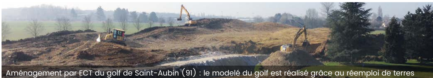
Aménagement par ECT du golf de Saint-Aubin (91) : le modelé du golf est réalisé grâce au réemploi de terres

ECT propose aux collectivités comme aux gestionnaires privés de réaliser des projets de golfs fondés sur la valorisation de terres inertes excavées. La réutilisation de ces terres pour constituer le modelé du golf finance la conception et la réalisation du parcours et permet ainsi de disposer d'une plus grande capacité d'aménagement.