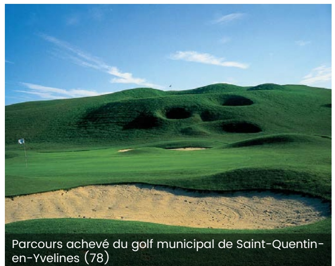
Parcours achevé du golf municipal de Saint-Quentin-en-Yvelines (78)