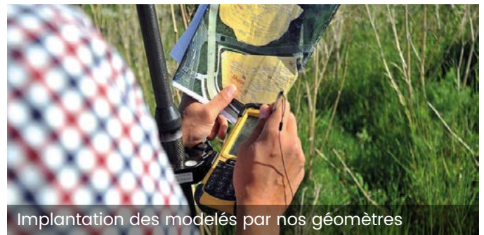
Implantation des modelés par nos géomètres