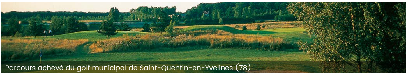
Parcours achevé du golf municipal de Saint-Quentin-en-Yvelines (78)