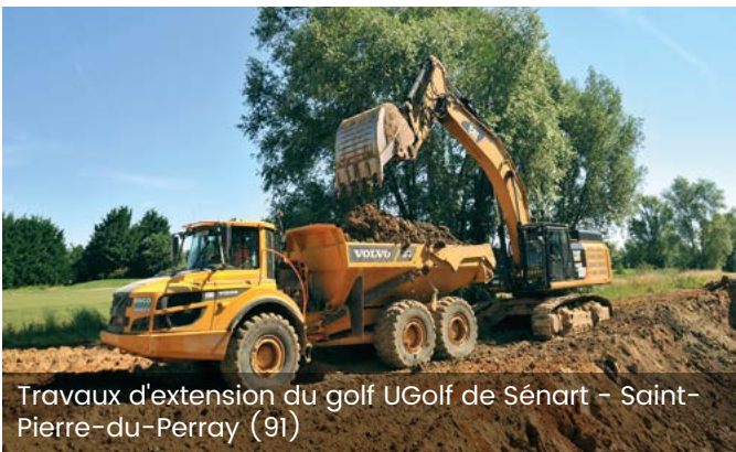
Travaux d'extension du golf UGolf de Sénart – Saint-Pierre-du-Perray (91)