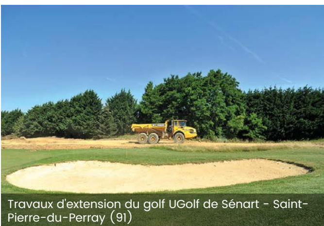
Travaux d'extension du golf UGolf de Sénart – Saint-Pierre-du-Perray (91)