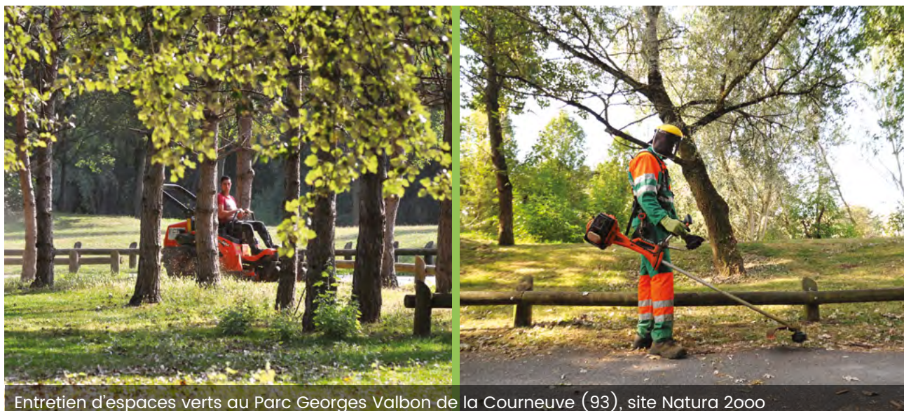
Entretien d'espaces verts au Parc Georges Valbon de la Courneuve (93), site Natura 2000

Nos équipes proposent l'entretien courant des espaces semés et plantés : fleurissement des massifs, débroussaillage, fauchage et élagage des terrains, tonte des pelouses, taille des haies, ramassage de feuilles. Des prestations plus spécifiques sont également réalisées : l'entretien de prairies fleuries, la maintenance de cimetières, le nettoyage de bassins ou le broyage de déchets végétaux. Un parc diversifié d'engins permet de réaliser tous types de travaux et de répondre largement aux souhaits et aux consultations des collectivités.