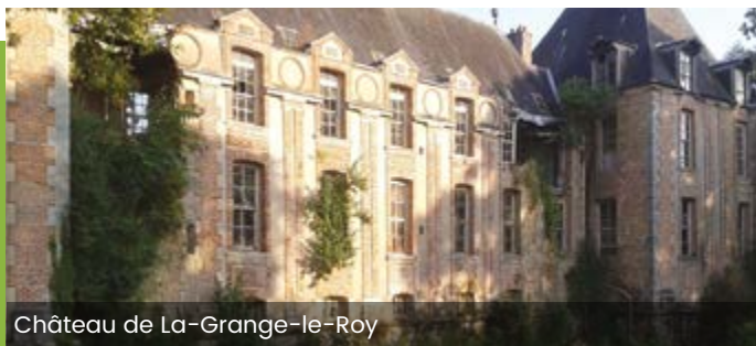
Château de La-Grange-le-Roy

Plusieurs projets antérieurs ont échoué à réhabiliter le domaine de La-Grange-le-Roy, qui présente aujourd'hui toutes les caractéristiques d'un site en déshérence.