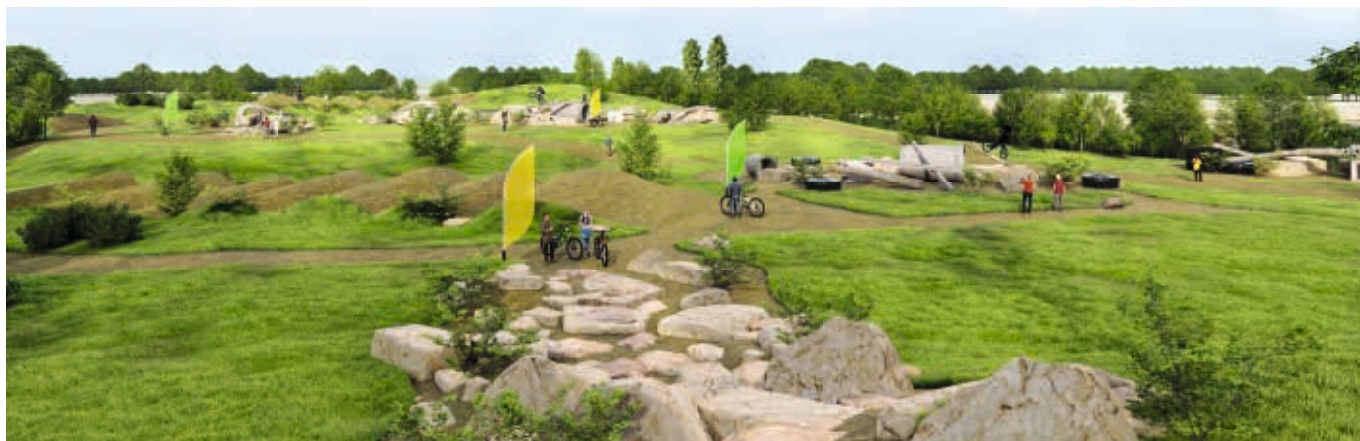
Vue du projet de stadium VTT et trial