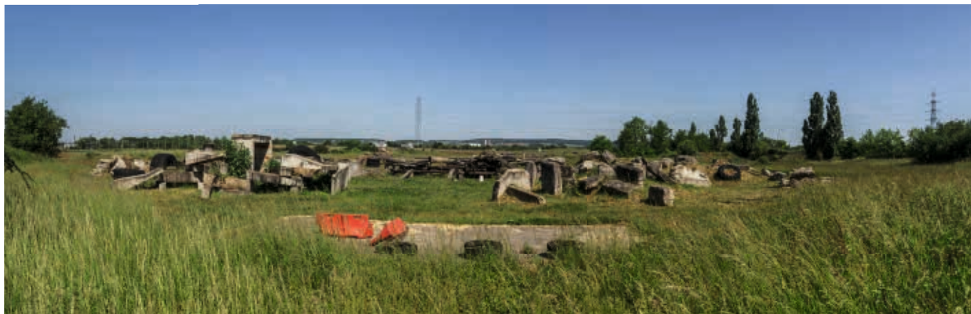
Le site en mai 2020