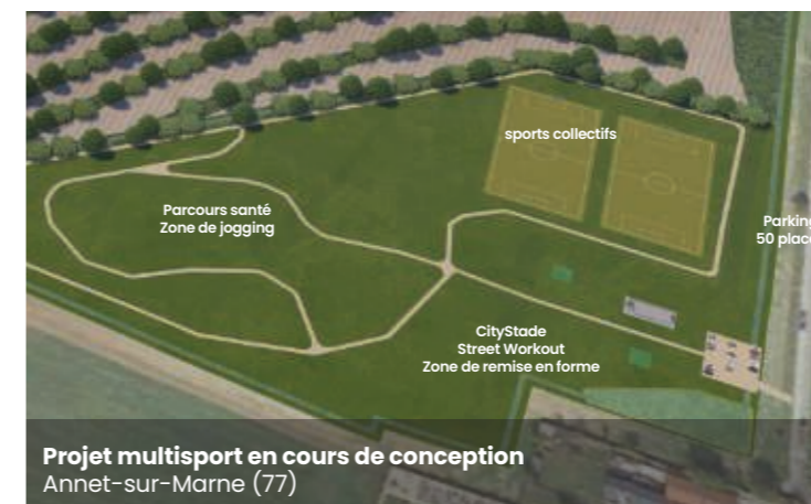
Projet multisport en cours de conception Annet-sur-Marne (77)

Pour adapter au mieux le projet, ECT met en œuvre un concept de "plateaux sportifs" dédiés à une ou plusieurs activités.