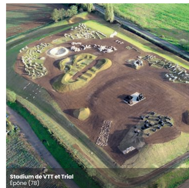
Stadium de VTT et Trial Épône (78)