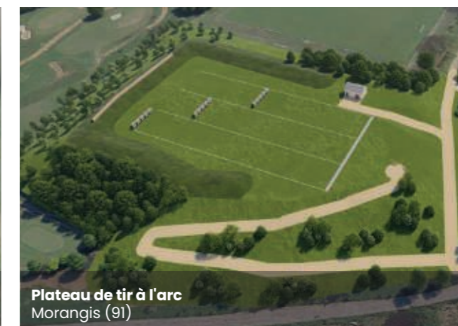
Plateau de tir à l'arc Morangis (91)