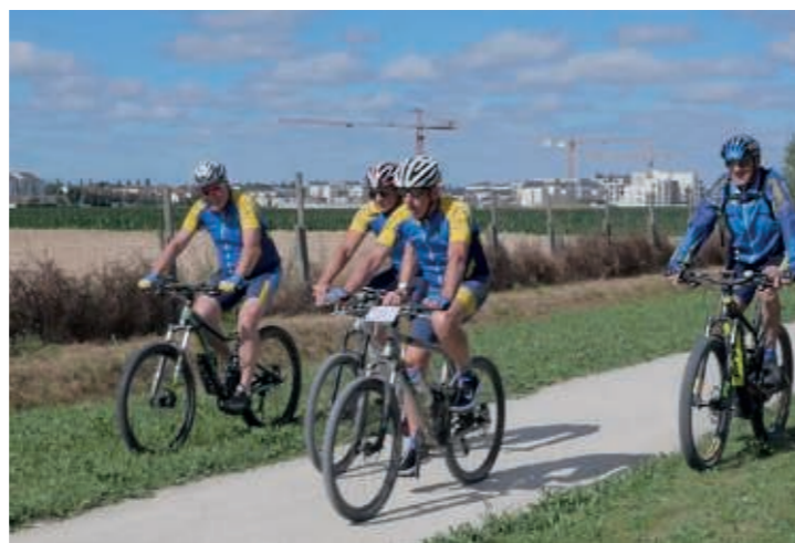
Association cycliste de Moissy-Cramayel au Parc de l'Arboretum

En valorisant les terres inertes excavées des chantiers de proximité du BTP, ECT propose aux collectivités de réaliser et de financer des parcs urbains qui dès leur conception incluent des parcours et équipements sportifs variés et de qualité.