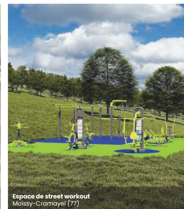
Espace de street workout Moissy-Cramayel (77)