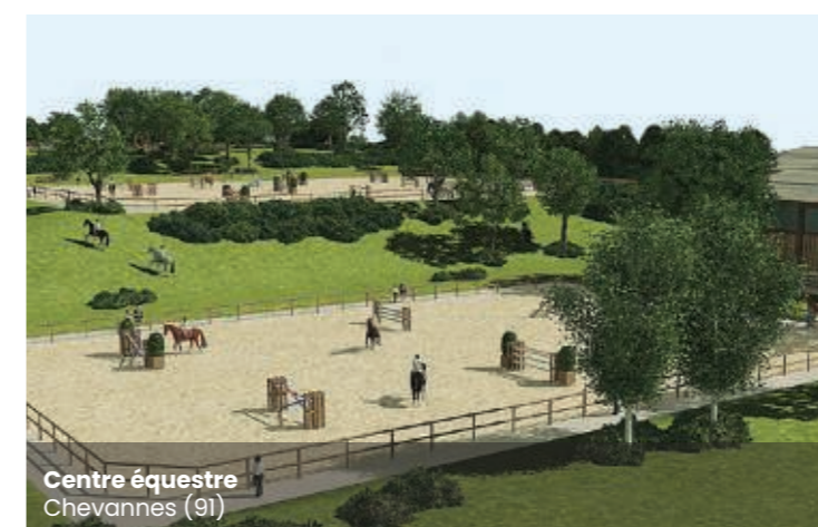
Centre équestre Chevannes (91)

Ce concept de "plateaux sportifs" permet d'optimiser l'espace, nouvellement créé par l'apport de terres, en une succession de terrasses où l'on peut intégrer : city stade, agrès de street workout, plateau de tir à l'arc, terrain de football, de volley-ball ou même un centre équestre, voire une butte d'envol de parapente.