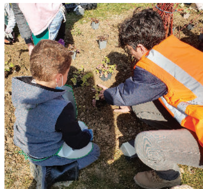
Mars 2022, les enfants de l'école d'Iverny participent à la végétalisation du parc.

Au 1 er trimestre 2022, les enfants de l'école d'Iverny ont pu découvrir le nouveau parc et participer à la plantation d'arbres pour contribuer directement à la renaturation du site.