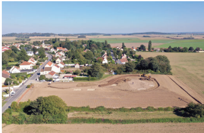
Été 2021, apport et mise en œuvre des terres inertes

Le projet a été réalisé et financé par ECT grâce à la réutilisation des terres inertes issues des chantiers locaux du BTP. L'expertise d'ECT a assuré l'analyse, la caractérisation, la traçabilité et le contrôle des terres inertes reçues.