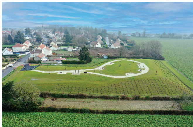
2022, création du Parc de la Plaine