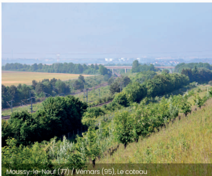
Moissy-le-Neuf (77) / Vémars (95), Le coteau