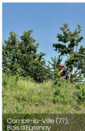
Combs-la-Ville (77), Bois d'Egrenay