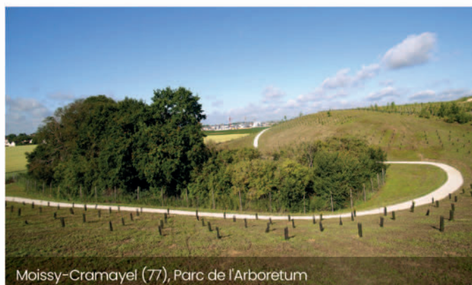
Moissy-Cramayel (77), Parc de l'Arboretum