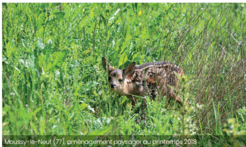
Moussy-le-Neuf (77), aménagement paysager au printemps 2018

La recréation de boisements et d'espaces de nature favorise les sols perméables de pleine-terre. La végétalisation du site participe pleinement aux objectifs pérennes de non-artificialisation des sols et à la reconstitution d'îlots de fraîcheur. Quelques courtes années après la fin des travaux d'aménagement, la renaturation s'achève avec la reconquête des lieux par la flore et la faune locales.