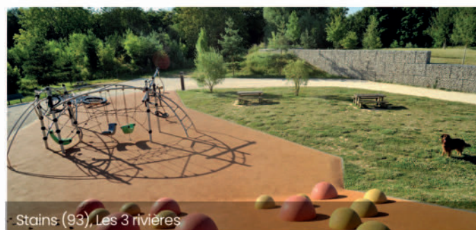
Stains (93), Les 3 rivières