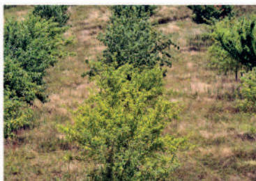
Villeneuve-sous-Dammartin (77), Le verger