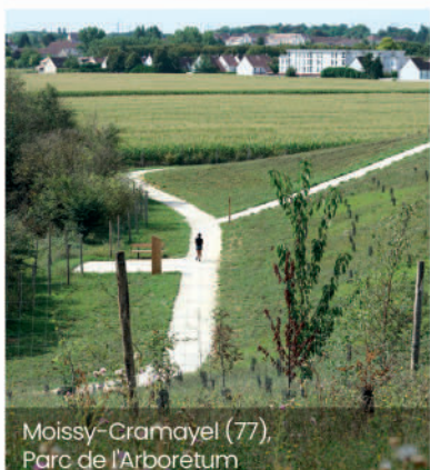
Moissy-Cramayel (77), Parc de l'Arboretum