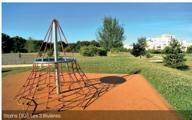
Stains (93), Les 3 Rivières