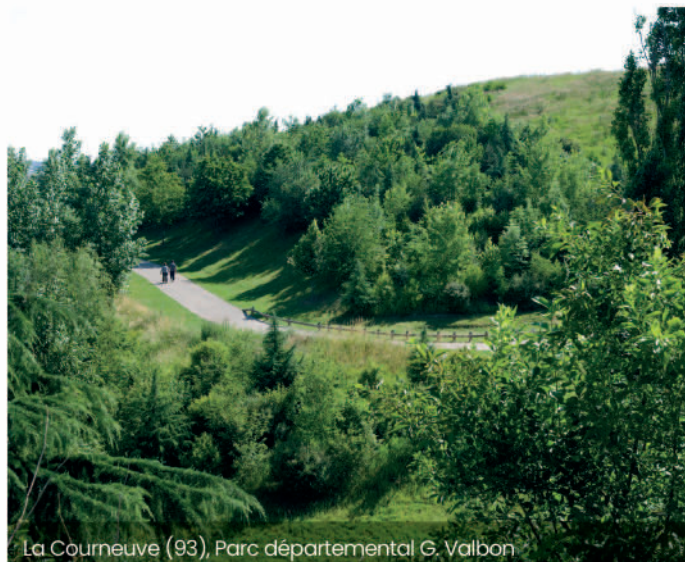
La Courneuve (93), Parc départemental G. Valbon